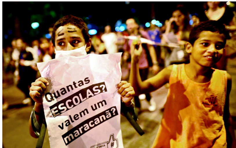
PÅ MARSCH. Två pojkar i favelan Rocinha håller upp ett plakat med texten: ”Hur många skolor kostar ett maracanã-stadion?”

På grund av den politiska kulturen inom rättsväsendet har han