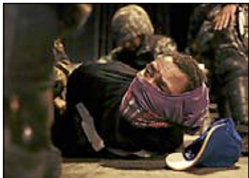
Många demonstranter grips av polis.

Problemet är inte pengarna. Det brasilianska skattetrycket ligger på 36 procent, vilket är det högsta i utvecklingsvärlden och i nivå med flera europeiska länder. Problemet är att en stor del av pengarna försvinner i korrupktion. Den politiska klassen behandlar skattepengarna som sina egna och väljarna har mer eller mindre accepterat att det är så.